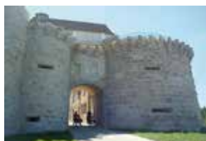
La Porte neuve Porte fortifiée du 16e située sur les remparts Nord

A Vézelay, Moyen-Âge et modernité se côtoient. Les vieilles maisons étagées à flanc de colline sur de magnifiques caves voûtées qui, aux siècles passés, accueillirent les pèlerins, les ruelles serpentant à travers les jardins, le chemin de ronde et les anciennes portes... Tous ces charmes font de Vézelay un des plus beaux villages de France