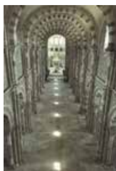
Chemin de lumière

Situé avant la nef, lieu de préparation au recueillement des pèlerins, au centre le grand tympan du Christ en gloire