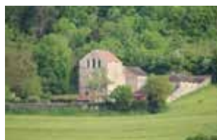
La Chapelle de la Cordelle Située sur le flanc Nord de la colline, premier ermitage franciscain de France