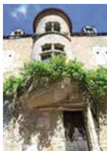
La Tourelle Gaillon Tour du 15e en encorbellement (rue St-Pierre)